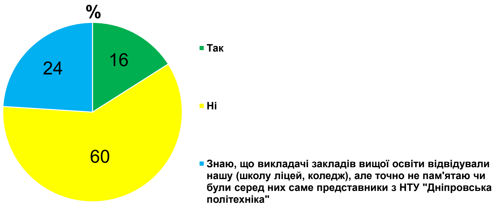
Рисунок 2 – розподіл відповідей респондентів щодо відвідування їх навчального закладу представниками НТУ “Дніпровська політехніка” з профорієнтаційною метою

Висновок: більшість опитаних студентів ( 60% ) зазначили, що представники НТУ “Дніпровська політехніка” не відвідували заклади освіти з профорієнтаційною метою.