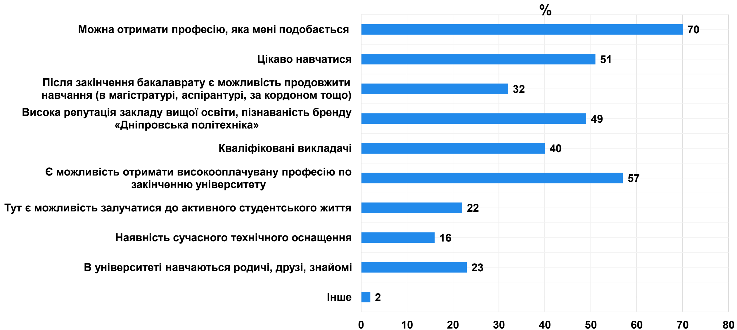
Рисунок 1 – розподіл відповідей студентів щодо мотивів вибору спеціальності, на якій вони навчаються (респонденти могли обрати декілька варіантів, тому результати можуть перевищувати 100%)