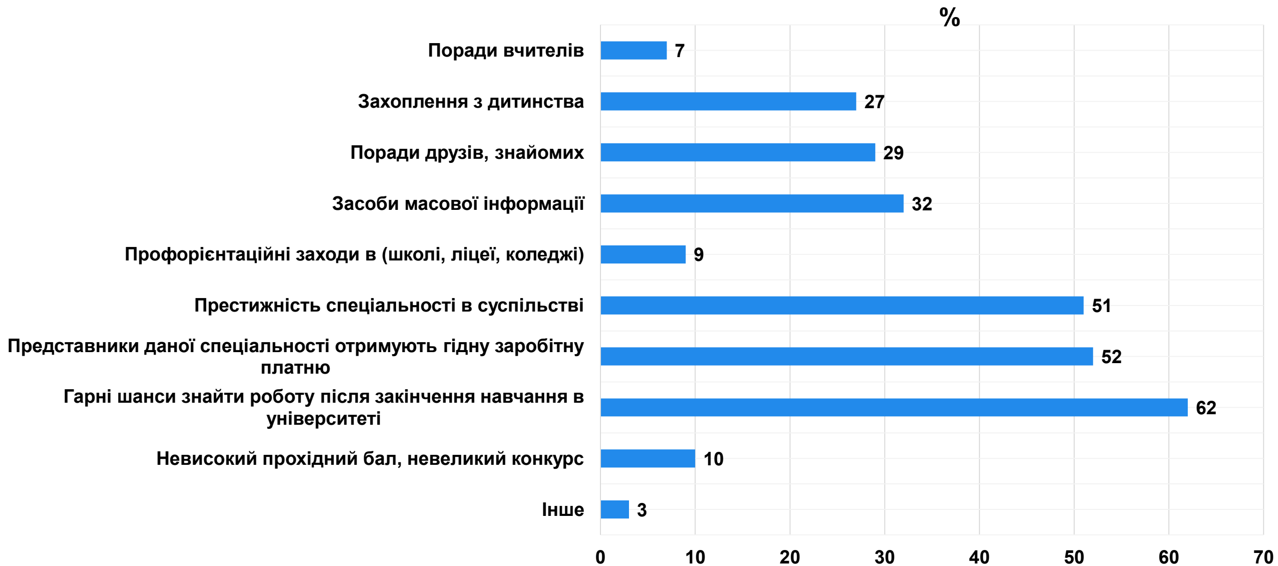
Рисунок 3 – розподіл відповідей студентів щодо чинників, що вплинули на вибір спеціальності, на якій вони навчаються (респонденти могли обрати декілька варіантів, тому результати можуть перевищувати 100%)