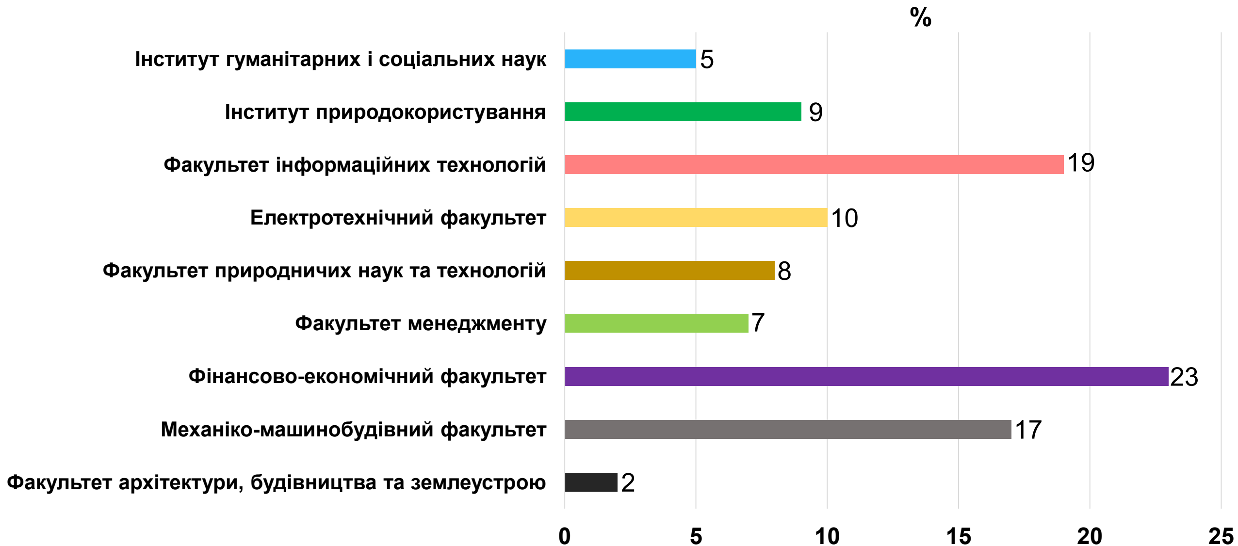
Рисунок 6 – факультети та інститути, студенти яких прийняли участь в опитуванні